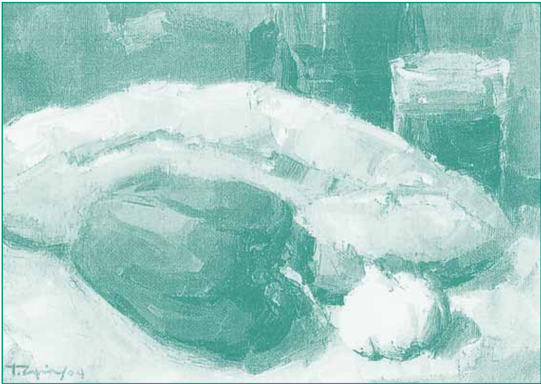
Χρυσ. Τζημάκας, «Στο τραπέζι του φτωχού», λάδι με σπάτουλα σε χαρτόνι, 18×25 εκ., 2004.