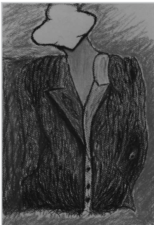
Κομψή κυρία, 35 x 50cm.

Βέβαια, αυτές οι ιστορίες ούτε στο σινεμά ούτε στη ζωή έχουν καλή εξέλιξη κι ευτυχές τέλος. Το σίγουρο, όμως, είναι – και αυτό δεν αποτελεί ηθικολογία – πως σε τέτοιες περιπτώσεις την πληρώνουν είτε με τη ζωή τους ή με την υγεία τους ή με την κοινωνική τους πτώση οι διάφοροι χρήστες σ' έναν κόσμο που συνεχώς πιέζει τα άτομα.