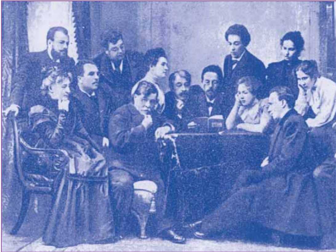
Ο Τσέχωφ διαβάζοντας τον Γλάρο στους ηθοποιούς του Θεάτρου Τέχνης το 1898.

τη χάραξη δρόμων. Αυτά τα χρόνια ιατρικής πείρας έδωσαν υλικό για τα βιβλία του Μουσικοί και Μέσα στη ρεματιά . Στο Μελίχοβο έγραψε και τα θεατρικά του έργα Ο γλάρος και ο Θεός Βάνιας όπου δείχνει τον μαρασμό των ψυχών σε συνθήκες καταπίεσης και την ελπίδα και επίκληση για μια καλύτερη ζωή. Αλησμόνητα είναι τα λόγια παρηγόριας της Σόνιας στον Θεό Βάνια : «Θα αναπαυθούμε, θα ακούμε τους αγγέλους, θα δούμε όλο τον ουρανό φωτισμένο με αστέρια σαν διαμάντια. Θα δούμε πως όλη μας η κακία εδώ κάτω στη γη, όλα μας τα πάθη, όλοι μας οι πόνοι θα αφανιστούνε μέσα στο έλεος που θα πλημμυρίσει όλο τον κόσμο». Αυτό το κείμενο το μελοποίησε ο Ραχμάνινοφ αναδεικνύοντας τη μουσικότητα που έχουν τα θεατρικά έργα του Τσέχωφ μαζί με ένα άλλο ιδίωμα, τη δραματική σιωπή.