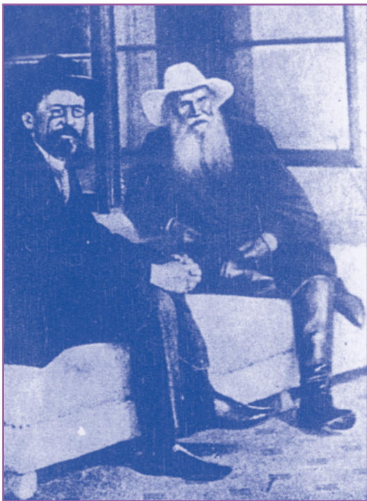
Ο Τσέχωφ και ο Τολστόι το 1901.

Όταν έγινε 19 ετών, έφτασε και αυτός στη Μόσχα και γράφτηκε στην Ιατρική Σχολή και δεν μετά-νιωσε ποτέ γι' αυτό, όπως έλεγε αργότερα. Από την πρώτη χρονιά της φοίτησής του, άρχισε να δημοσιεύει σατιρικά κείμενα σε περιοδικά και κωμικά διηγήματα με διάφορα ψευδώνυμα χωρίς να έχει αξιώσεις ανάδειξης. Οι λογοτεχνικές του επιδόσεις πήραν σύντομα επαγγελματικό χαρακτήρα. Τότε έμενε όλη η οικογένεια μαζί σε ένα υγρό υπόγειο και αυτός έπρεπε να δουλεύει χωρίς ανάπαυλα. Κερδίζει χρήματα με όλα τα μέσα: μαθήματα, προγυμνάσεις, χρονογραφήματα, παίρνει πάνω του όλες τις οικογενειακές ευθύνες «για τις οποίες δεν ήταν καμωμένος». Η εξέλιξή του στα γράμματα έγινε με ένα τρόπο φυσικό και αθόρυβο γιατί ήταν από την αρχή μετριόφρων. Σε ηλικία 24 ετών, τελειώνει το Πανεπιστήμιο. Αρχικά εξασκεί την ιατρική στα περίχωρα της Μόσχας, στο Ζέμτσοβο, 80 χιλιόμετρα περίπου μακριά. Παρακολουθεί προσεκτικά όλες τις ιατρικές καινοτομίες, τρέχει στα γύρω χωριά, δέχεται αρρώστους, κάνει διαλέξεις και γράφει σε φίλους του. «Όσο είμαι γιατρός στο Ζέμτσοβο, μη με λογαριάζετε για λογοτέχνη». Αλλά πάντα βρίσκει ώρες για να γράφει τα μικρά του διηγήματα. Σ' αυτά αναδεικνύεται ένας λεπτός ψυχολόγος που