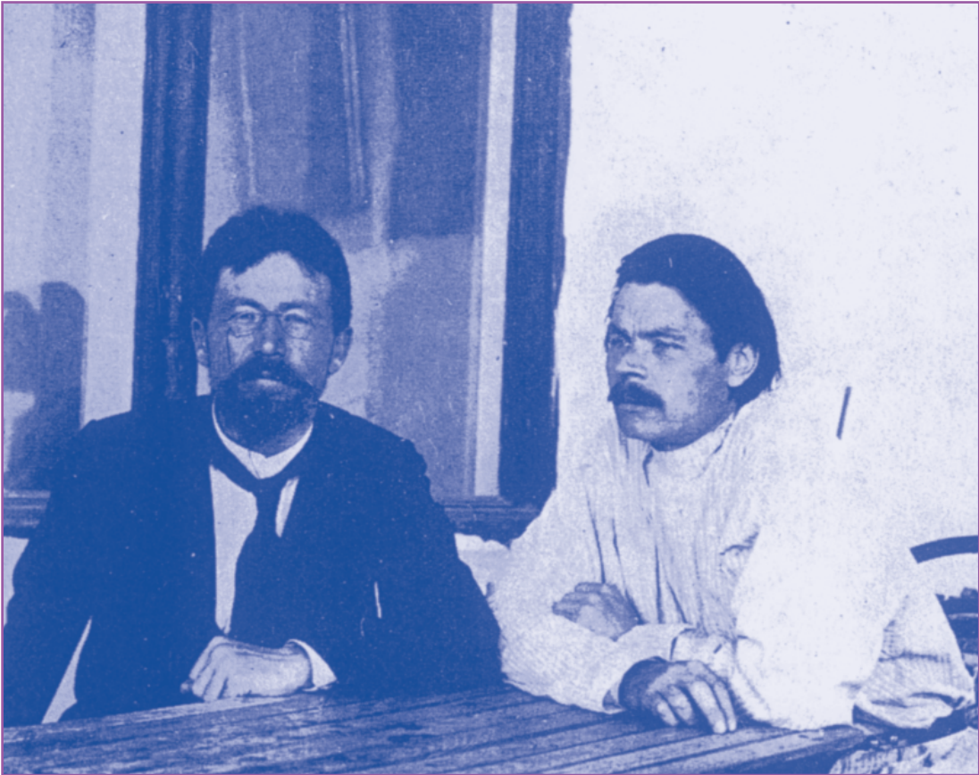
Ο Τσέχωφ και ο Γκόρκυ το 1901.

στους χωρικούς. Από νωρίς κατέφθαναν οι άρρωστοι, παιδιά, γυναίκες, μουζικοί, μικρομαγαζάτορες. Ο ίδιος σημειώνει «από τον Αύγουστο του 1892 έως τον Οκτώβριο εξέτασα περίπου 1.000 ασθενείς». Θεράπευε με ελάχιστη αμοιβή, προμήθευε τα αναγκαία φάρμακα που τα ετοίμαζε η αδελφή του η Μαρία, είχε και μικροσκόπιο για μικροβιολογικές εξετάσεις. Σαν γιατρός μπόρεσε να πλησιάσει τα πιο διαφορετικά κοινωνικά στρώματα «ο μουζικός με την ανοιγμένη κοιλιά από δικράνι, το ζεματισμένο παιδί, η νοσοκόμα που συνήθισε να παίρνει μορφίνη και κατέληξε σε άσυλο, η νεαρή σύζυγος που μολύνθηκε από τον άνδρα της που είχε σύφιλη, το κοριτσάκι με το αυτί γεμάτο σκουλήκια». Τα βράδια, όταν δεν είχε άλλες υποχρεώσεις έγραφε. Τότε δημοσίευσε τη νουβέλα Ο θάλαμος Νο 6 , όπου περιγράφει την πορεία του γιατρού Ράνγκιν που από διευθυντής σε ένα επαρχιακό νοσοκομείο καταλήγει να τον κλείσουν οι υφιστάμενοί του στο άσυλο επειδή