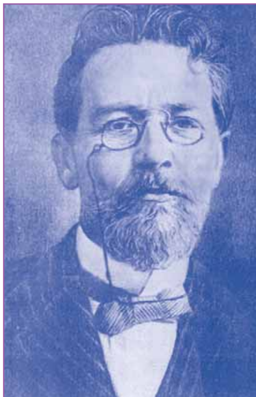
Ο Τσέχωφ το 1904.

Όταν έγινε 16 ετών ο πατέρας του χρεοκόπησε και για να αποφύγει τη φυλάκιση κατέφυγε στη Μόσχα. Ο Τσέχωφ έμεινε μόνος στη γενέτειρά του και ώσπου να τελειώσει το Λύκειο ζούσε με μεγάλες στερήσεις παραδίδοντας μαθήματα.