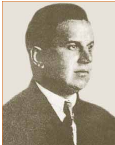
Φωτ. 6. Βασίλειος Νομικός: Ιατρός Χειρουργός, ιδρυτικό μέλος της Ι.Ε.Θ. (Δημοσιεύθηκε στο περιοδικό Ελληνική Ιατρική, 1929).