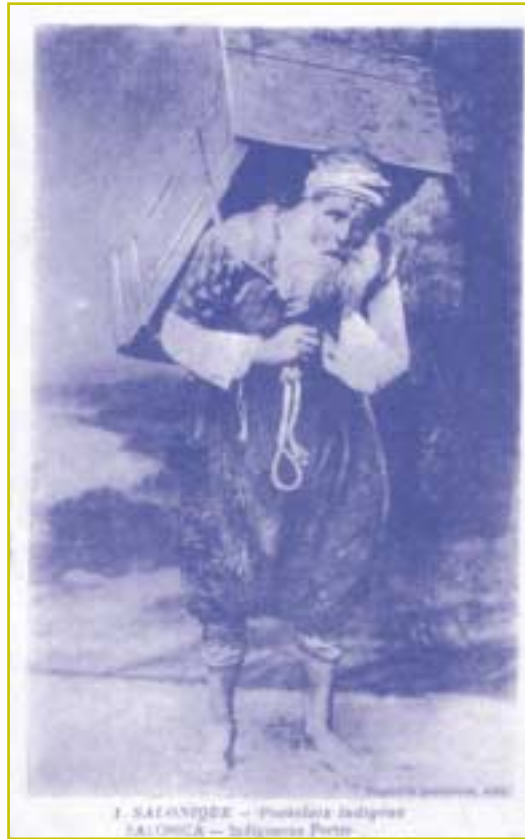
Εβραίος χαμάλης κατά την ώρα της εργασίας.

Ο Εβραίος ηρνήθη να δώση χείρα εις την εκφόρτωσιν, εν ημέρα Σαββάτου. Δεν ήξευρεν ο Τσιφούτης, ότι «έξεστιν εν Σαββάτω αγαθοποι-