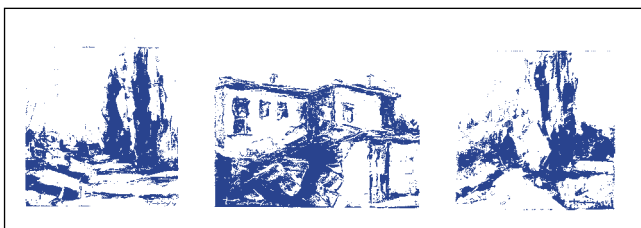
Χρυσόστομος Τζημάκας Πνευμονολόγος Θεσσαλονίκη «Τρίπτυχο – Βογατσικό» Λάδι με σπάτουλα 51 × 14 cm

μονή, η υπομονή, η σκληρή δουλειά, η ανθρωπιά δικαιώνουν τον γιατρό στη συνείδηση τόσο των αρρώστων όσο και των άλλων συναδέλφων του.