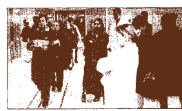
Πολύ λίγος χρόνος για την υγεία των ασθενών γίνεται στις εφημερίες, λόγω της ελλείψης ιατρικού και νοσηλευτικού προσωπικού.

Με ανεπαρκές προσωπικό και σοβαρές ελλείψεις σε εξοπλισμό, που υποβοηθούν τις παρεχόμενες υπηρεσίες και συνιστούν κίνδυνο για την υγεία των ασθενών, λειτουργούν τα νοσοκομεία της Βόρειας Ελλάδας. Ρεπόρταζ: Μιχάλης Νέου