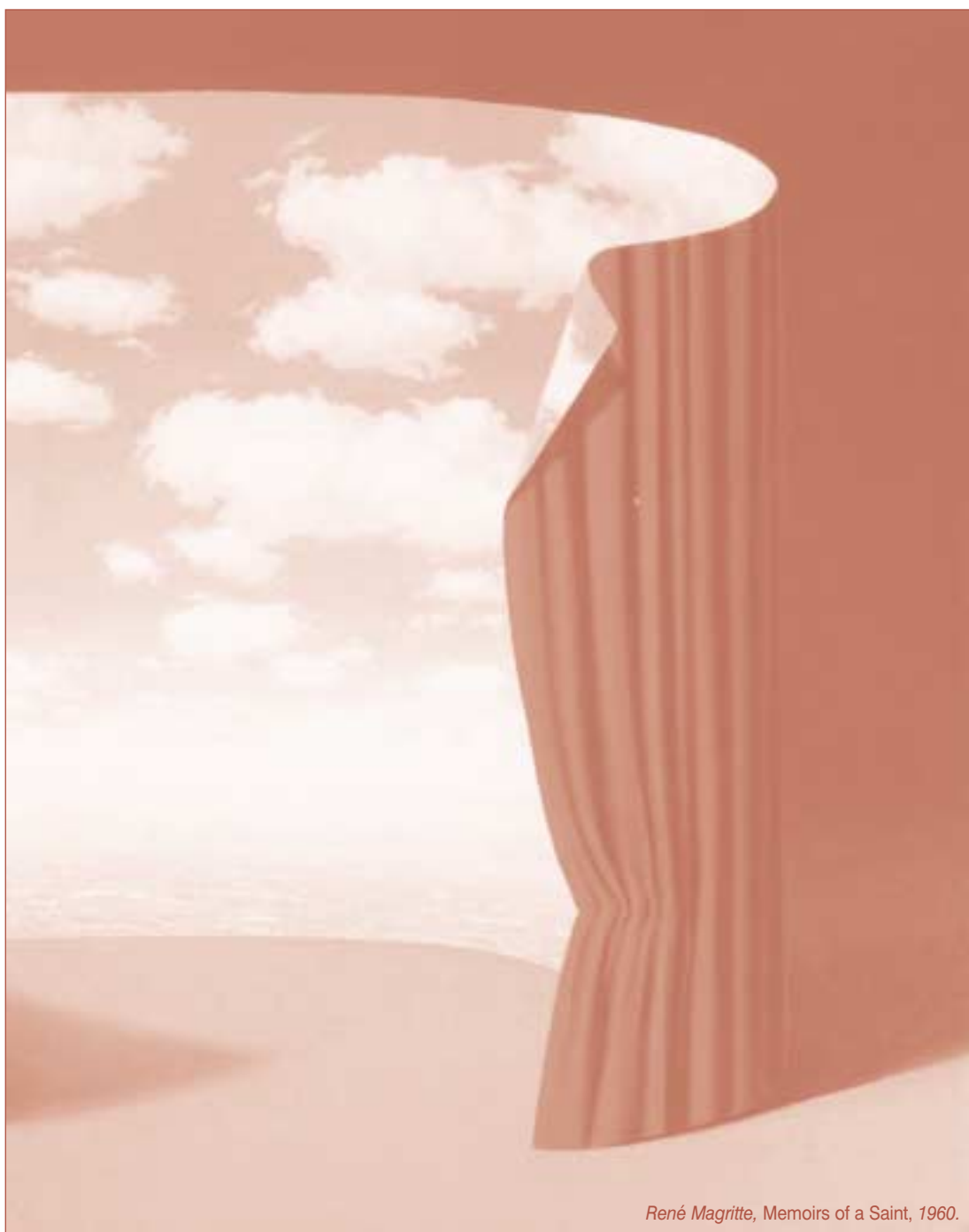
René Magritte, Memoirs of a Saint , 1960.

συμμετέχετε στη λύση των προβλημάτων. Χωρίς τη συμμετοχή σας δεν μπορούμε να ελπίζουμε ότι οι αποφάσεις μας βρίσκονται στη σωστή κατεύθυνση.