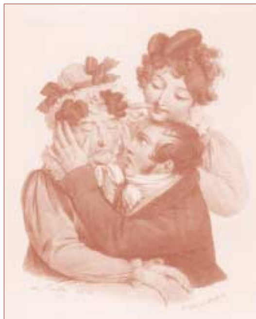
Louis Leopold Boilly, Caricature on Magnetism, 1826.

☺ Μεγάλη πυρκαγιά κατακαίει τις εγκαταστάσεις στη 'Φάρμα', ευτυχώς χωρίς ανθρώπινα θύματα. Ξεσπά πόλεμος μεταξύ των καναλιών που αλληλοκατηγορούνται.