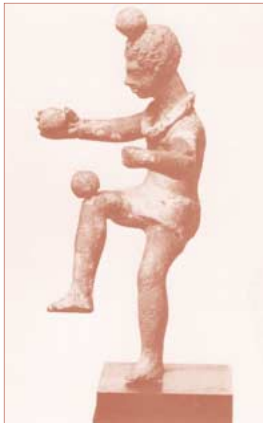
A Greek terra-cotta figure of a juggler, third century B.C.

☺ Καμιά πυρκαγιά δεν έχει σημειωθεί μέχρι τώρα στα δάση μας μετά τα τελευταία μέτρα που έλαβε η κυβέρνηση. Αυτό δηλώνει περιχαρής στα ΜΜΕ ο Υπουργός Άκης Τσοχατζόπουλος. Την ίδια ώρα καίγεται το τελευταίο κομμάτι πρασίνου στην Πάρνηθα. Οι υποψίες βαρύνουν τον επίτιμο Κωνσταντίνο Μητσοτάκη που κάνει πικ νικ σε μια