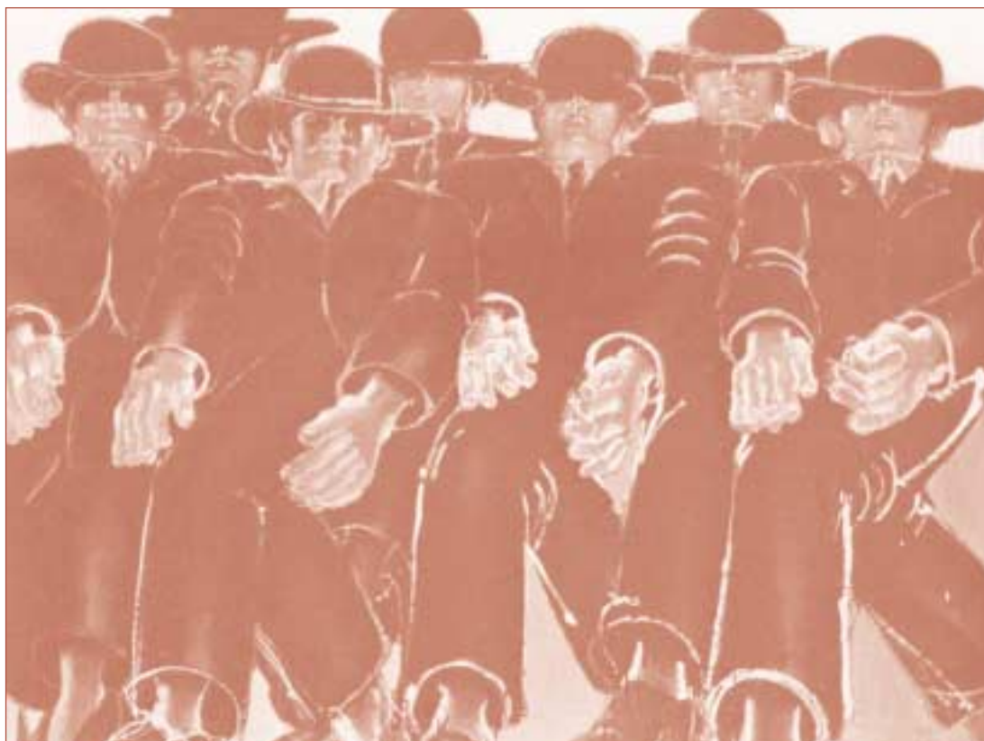
Lester Johnson (1919- ), Seven Men with Hats.