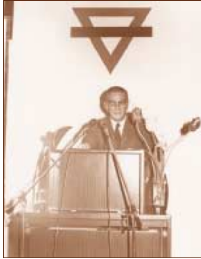
Ο Καθηγητής Θ. Εδιπίδης σε διάλεξη στη Χ.Α.Ν.Θ.

Το 1931 ύστερα από επιτυχείς εισαγωγικές εξετάσεις εισέρχεται στην Ιατρική Σχολή του Πανεπιστημίου Αθηνών, από την οποία αποφοίτησε τον Μάιο του 1937 με βαθμό «λίαν καλώς». Έκτοτε αρχίζει μια γόνιμη περίοδος ενασχόλησής του με τους τομείς της μικροβιολογίας και της υγιεινής, η οποία σταδιακά θα του προσδώσει κύρος